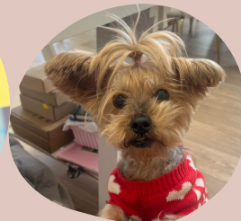
FRIDA Y TINA Aportan perronalidad y amor