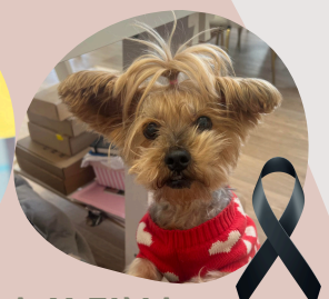
FRIDA Y TINA Aportan personalidad y amor